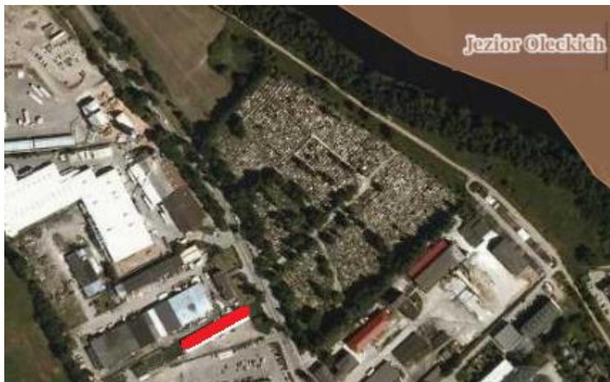
Ryc.3. Położenie terenu opracowania na tle obszarów chronionych (Obszar Chronionego Krajobrazu „Jezior Oleckich” ok. 350 m)

Najbliższy park narodowy, Wigierski Park Narodowy znajduje się w odległości ok. 30 km na wschód, parki krajobrazowe Puszczy Rominckiej ok. 25 km na północ i Suwalski Park Krajobrazowy ok. 28 km na północny wschód.