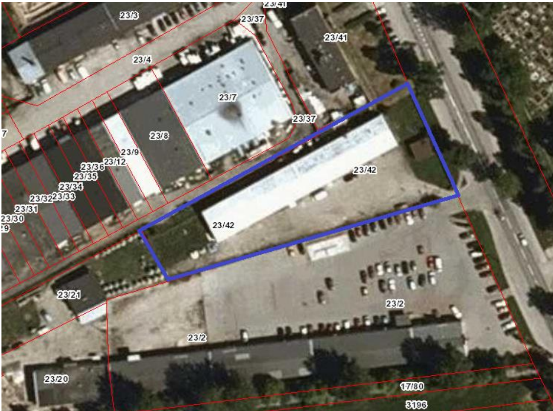
Ryc. 2 Położenie obszaru opracowania planu przy ulicy Góldapskiej w niedalekim sąsiedztwie cmentarza i sklepu Biedronka (ok. 31 m), zabudowa mieszkaniowa w odległości ok. 15-16 m