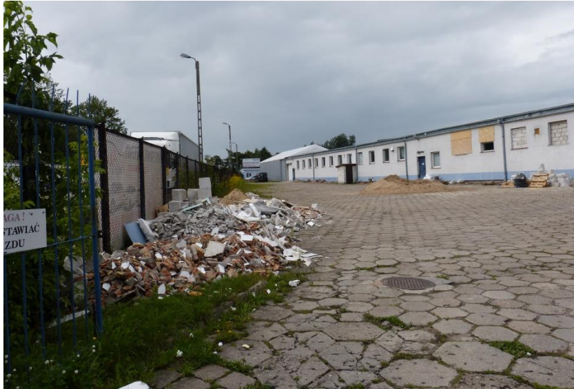
Fot.1 Teren planu- obecnie utwardzony (uzbrojony w sieć kanalizacji sanitarnej i wodociąg) z zabudową usługową, usług nieuciążliwych (usługi tapicerskie) projekt planu przewiduje niewielki rozwój