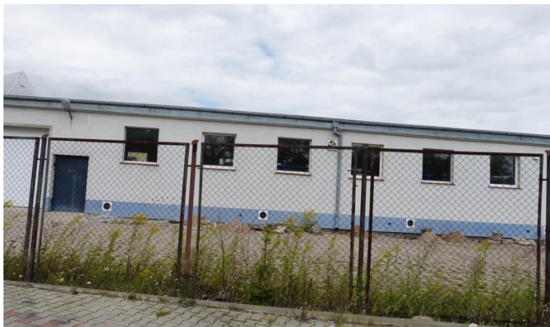
Fot.4 Roślinność ruderalna obszaru planu