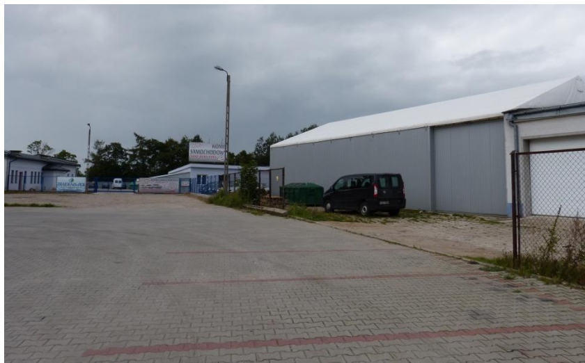
Fot. 2 Tereny sąsiadujące z terenem planu