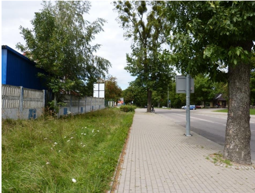
Fot. 3 Tereny zielone terenów sąsiednich, drzewa przydrożne

Walory biocenotyczne na obszarze planu posiadają drobne płyty zbiorowisk leśnych, kępy zarośli oraz szpalery drzew występujące wzdłuż dróg.